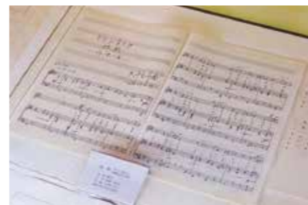
《中部大学校歌楽譜(自筆)、作曲 大中寅二・作詞 佐藤一英