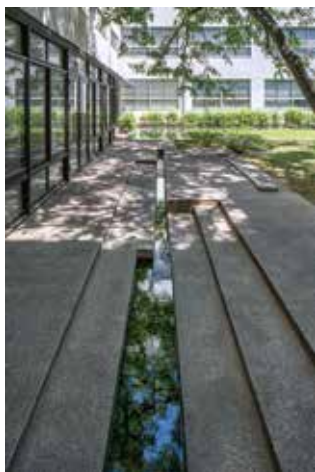
《みなもの庭》(2号館中庭) 作庭：岡田憲久

この場所は、大学開学当初の水源地で、水質を観察する場であるとともに大学開学30周年に現在の中庭に改修。大学発祥と水源の歴史を記念する場所としての意から庭の名称がつけられた。太陽と月をテーマにした石組みと水路を配し植栽を構成。無機的な建築空間に季節感を添えている。