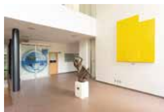
リサーチセンター内部

する美術家(市橋太郎[1940~])による平面作品がある。彫刻と絵画のコラボレーションによって、明るいリズムで調和された空間が生まれている。本学ではおよそ5点をオープンスペースに設置している。その他、1号館1階のアートギャラリーにて市橋太郎作品を複数展示している(P11参照)