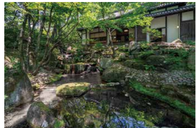
洞雲亭の書院建築と庭園