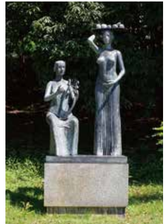
《太陽の詩》川原竜三郎 ブロンズ、10号館前 野外