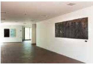
30号館1階エントランス風景

オーケストラの演奏風景が群像で表されている。30号館エントランス壁面に位置。エントランスの照明を控えめにし、建物西側のガラスからの採光によって通路の存在を示す効果がある。浮彫作品もこの静かな空間に溶け込んでいる。