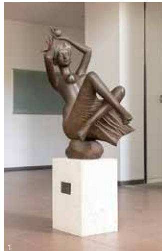
①《アドリアの実り》川原竜三郎、ブロンズ、リサーチセンター ②《Yellow Paintings》市橋太郎、油彩、リサーチセンター

する美術家(市橋太郎[1940~])による平面作品がある。彫刻と絵画のコラボレーションによって、明るいリズムで調和された空間が生まれている。本学ではおよそ5点をオープンスペースに設置している。その他、1号館1階のアートギャラリーにて市橋太郎作品を複数展示している(P11参照)