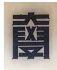
《中部大学校章原画(制作用写し)》(複写)、(原画デザイン: 亀倉雄策)