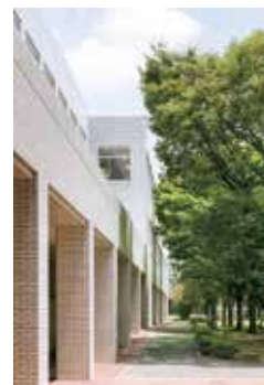
70号館と図書館をつなぐ煉瓦敷きの通路