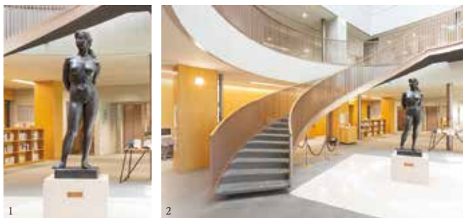
①《輝き》清水多嘉示、ブロンズ、中部大学附属三浦記念図書館 ②《図書館螺旋階段・天窓》、建築設計：株式会社第一工房(代表 高橋統一)