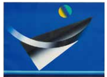
《弧のある風景 81-4》堀江良一、版画 総合情報センター