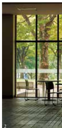
①潜龍池(紅葉に染まる天空と水辺) ②9号館ラウンジ(窓に映る樺並木) ③洞雲亭(書院)庭園(秋の景色)