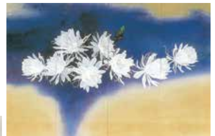
《宙(そら)》下川辰彦、日本画、71号館 群青と金色の空間に夏の一夜の花、月下美人を描いている。