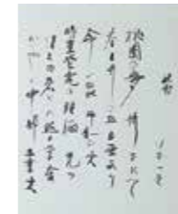
《中部大学校歌(自筆)(部分)》(書) 佐藤一英