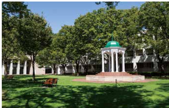
ロタンダのある広場

ロタンダは、大学開学30周年記念(1994年)に姉妹校オハイオ大学(アメリカ)より寄贈された尖塔クーポラの建築レプリカ。樺並木が囲う芝生の広場に建ち、四季折々の風景を作る。八角形のコラムの上にドーム型の屋根が載る。