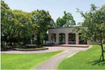
噴水のある広場(第3学生ホール前)