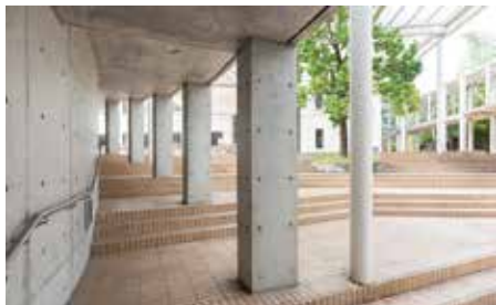
22号館(大講堂)・中庭・階段 建築設計：株式会社第一工房(代表 高橋誠一)