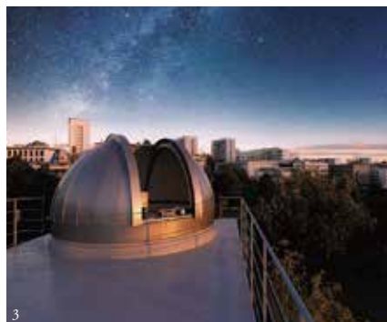
①9号館(池越しに眺める通学風景) ②25号館より(緑陰の広場と講義棟) ③天文台 天体観測所(夕陽に浮かぶ桃園の丘)