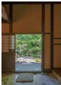
②洞雲亭からの眺め