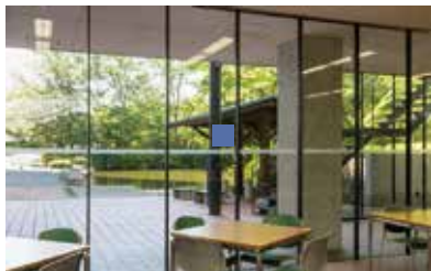
30号館ラウンジからの池の眺め