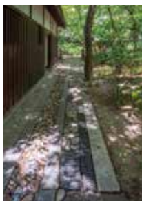
③書院建築(洞雲亭)と庭園