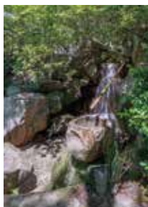
④工法庵・洞雲亭庭園の滝口の景