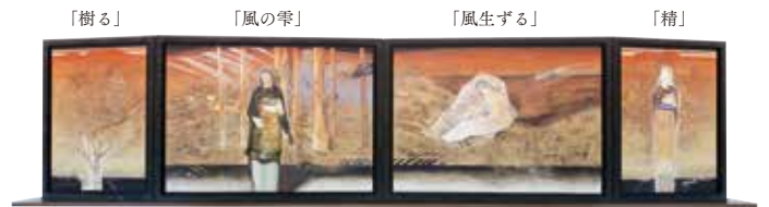
《風の棲家》平岡靖弘、油彩