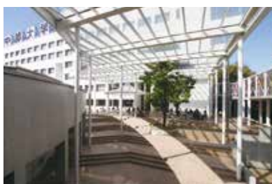
21号館とキャノピー、建築設計：株式会社第一工房(代表 高橋誠一)

21号館と22号館は、第19回中部建築賞を受賞(1987年)。階段状の中庭では陽光を感じながらベンチで憩うことのできる空間となっている。