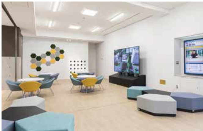
7号館ラウンジ風景

講義棟や実験棟などの複数のコンクリートビル群が集まる一隅に、白色を基調とした学部ラウンジがある。環境に配慮する観点から室内壁面に植物を植えこむグリーンパネルとグリーンポットを配し、限定空間でありながら明るく訪れる人を迎える場所としている。