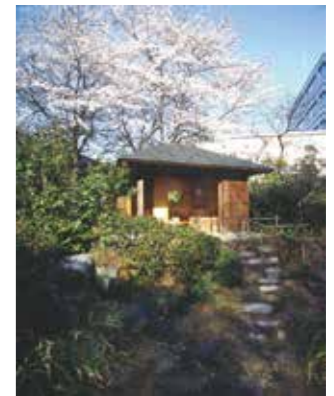
立礼式の茶席「爛柯軒」