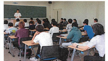
↑ 学生がスピーチする「日本語スキルA」の授業