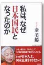
私は、なぜ日本国民となったのか (ワック)