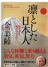
凛とした日本人 — 何を考え、何をすべきか (PHP文庫)