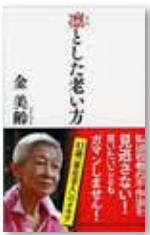
凛とした老い方 (PHP研究所)