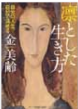
凛とした生き方 — 自分の人生、自分で決める (PHP文庫)