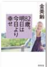
82歳。明日は今日より幸せ (幻冬舎)