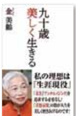
九十歳 美しく生きる (WAC BUNKO 267)