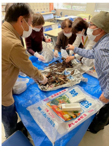
土壌改善・作物育成法の授業 手に取って確認します