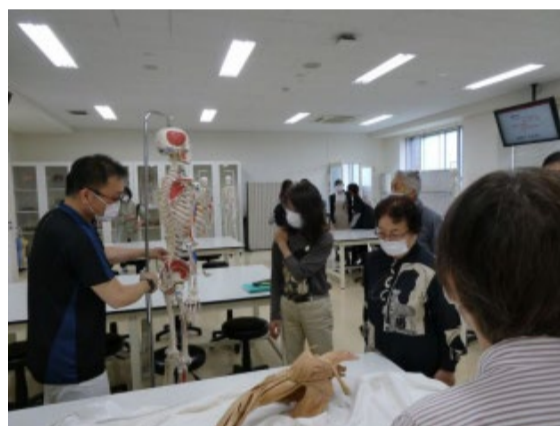
身体の構造・機能を 骨格モデルを見ながら学びます