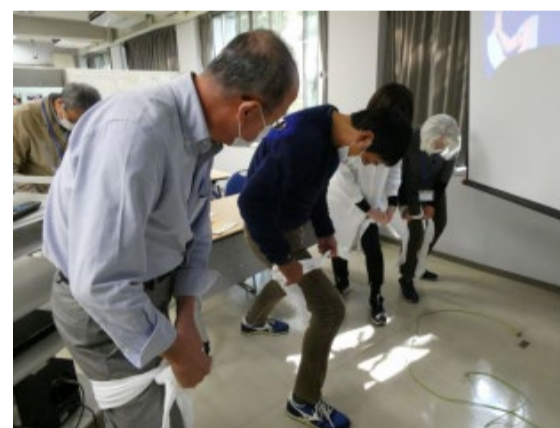
救急救命士から止血方法を学びます