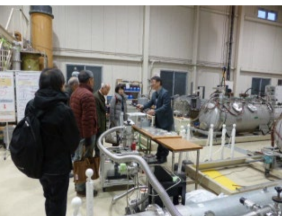
超伝導の研究・実験施設を見学