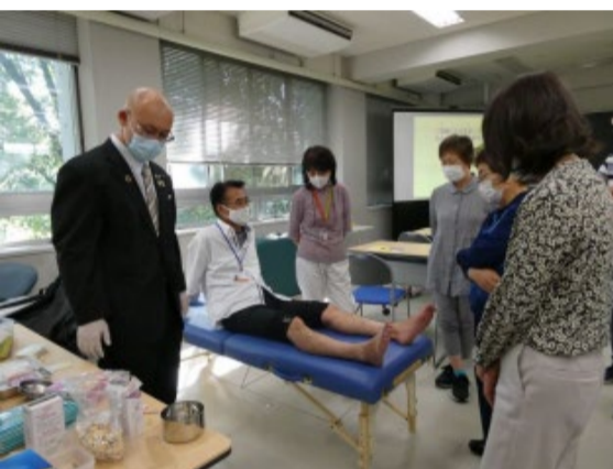
東洋医学を学ぶ授業では鍼灸を体験