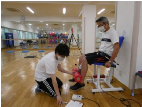
体力測定の様子 半年後の変化が楽しみです