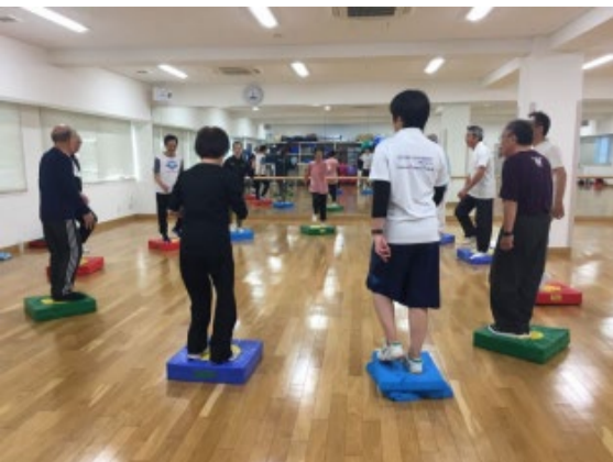
フィットネススタジオでの健康増進実習 スポーツ保健医療学科の学生がアシスタントに