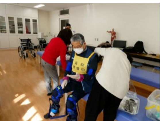
装具を身に付けての高齢者体験 理学療法士を目指す学生がサポートします