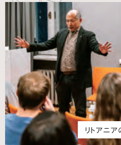
リトアニアの大学にて

Gateway to getting to know Eastern Europe