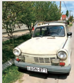
今ではめったに見なくなった 東独車トラバント モハーチ(ハンガリー)