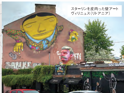
スターリンを皮肉った壁アート ヴェリニユス(リトアニア)