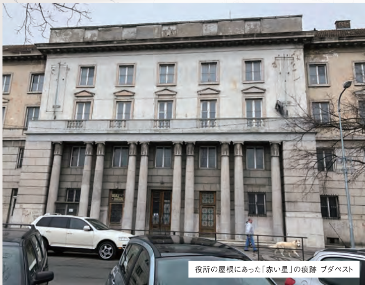
役所の屋根にあった「赤い星」の痕跡 ブダペスト