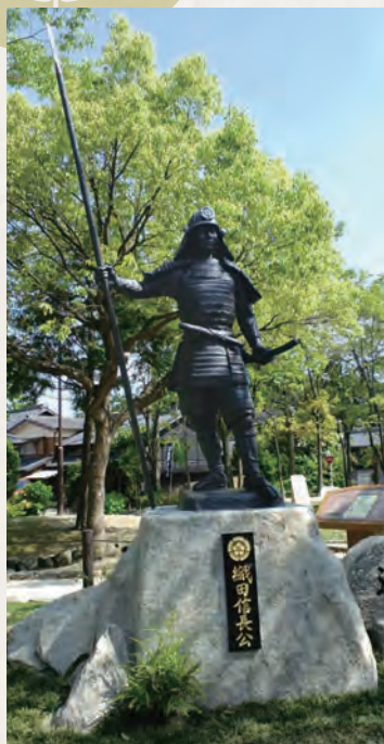
桶狭間公園の織田信長の像