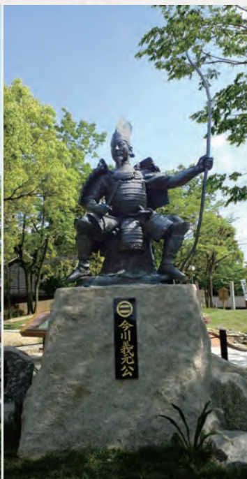
桶狭間公園の今川義元の像