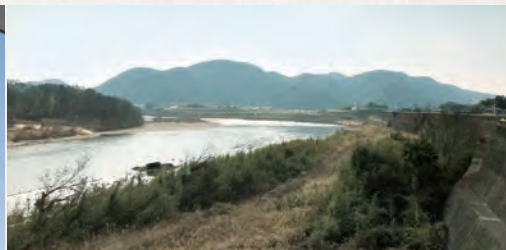
承久の乱古戦場跡 木曾川スポーツ公園付近