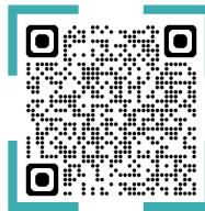
リスク予防管理士 申請フォーム