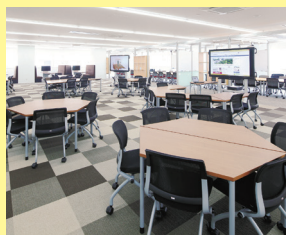
スチューデント・commons(不言実行館2階)