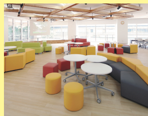
ラーニング・commons(不言実行館3階)