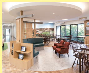
カージック・ラウンジ(20号館2階)