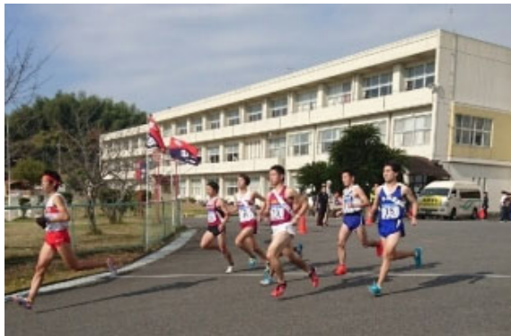
繰上げスタート(6区)