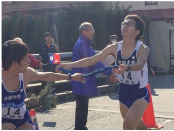
4区～5区に襷が繋がる