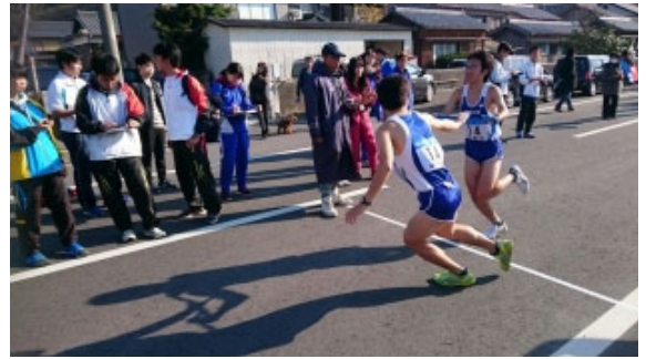
3区～4区に襷が繋がる